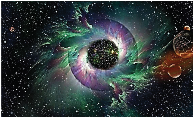
Ochi, Spațiu, Planete, Cosmos, Stele, Univers.

Între cosmos și iubire e un sacru legământ. Dacă omul este cu credință în Dumnezeu, Se creează o punte între cer și pământ, Focul iubirii e readus ca un nou Prometeu 1